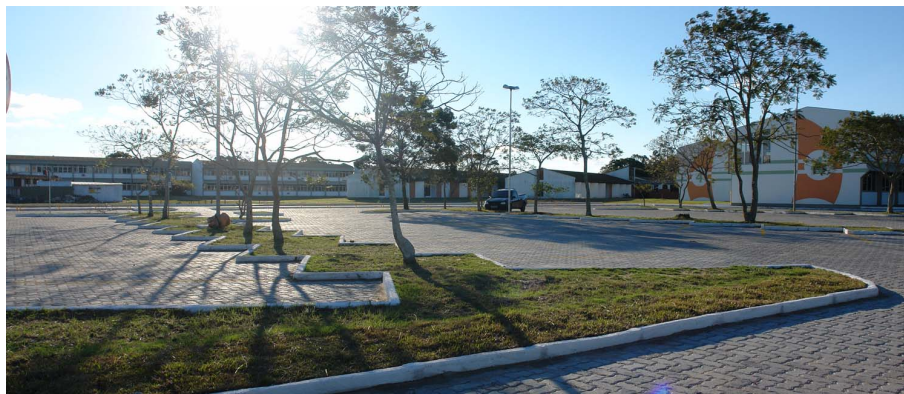
Figura 1. Tela inicial do jogo

X X X X X X X X X X X X X X X X X X X X X X X X X X X X X X X X X X X X X X X X X X X X X X X X X X X X X X X X X X X X X X X X X X X X X X X X X X X X X X X X X X X X X X X X X X X X X X X X X